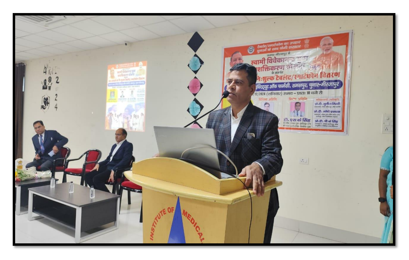
Speech by Tajmmul Afajal join director east zone varanasi