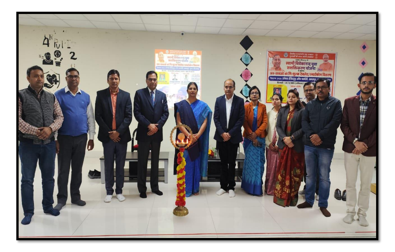
Lamplighting by Guest and pharmacy faculty